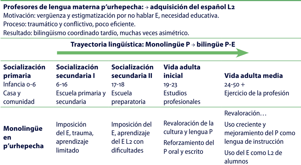
Tabla 3. Del español al p'urhepecha. Trayectoria lingüística de maestras y maestros entrevistados